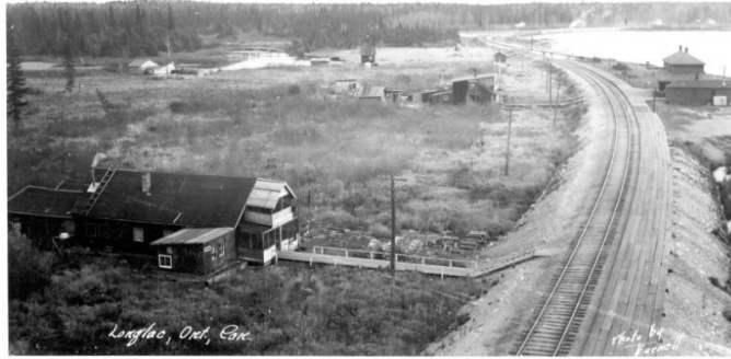
En regardant à l'est vers Longlac vers 1930. Le chemin de fer Canadien National traverse la rivière Kenogami River au nord du Lac Long. Ça a pris plus d'une décennie avant que La Route 11 ne soit complétée.

Par la Saint-Sylvestre 1942, le travail était terminé. . . ou presque. Il n'y avait pas de programme de déneigement et la débâcle printanière apportait ses propres problèmes. Les fonctionnaires ne se sont pas sentis suffisamment à l'aise pour ouvrir la route à la circulation civile avant la première semaine de juin 1943.