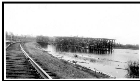
en regardant à l'est vers Longlac en 1941. Un pont sur chevalets est en construction pour passer au-dessus de la Rivière Kenogami pour accommoder la nouvelle route.

L'année 2018 marquera le 75e anniversaire de l'achèvement de la première route transcanadienne de l'Ontario. Un groupe de bénévoles font des plans pour commémorer l'anniversaire, des plans qui comprennent la participation des communautés organisées le long de la route (par exemple Greenstone et Hearst) et plus loin (par exemple Nipigon, Thunder Bay, North Bay) et des représentants des gouvernements fédéral et provinciaux. Cet événement historique, l'achèvement du dernier lien, mérite d'être reconnu et célébré par tous les Canadiens.